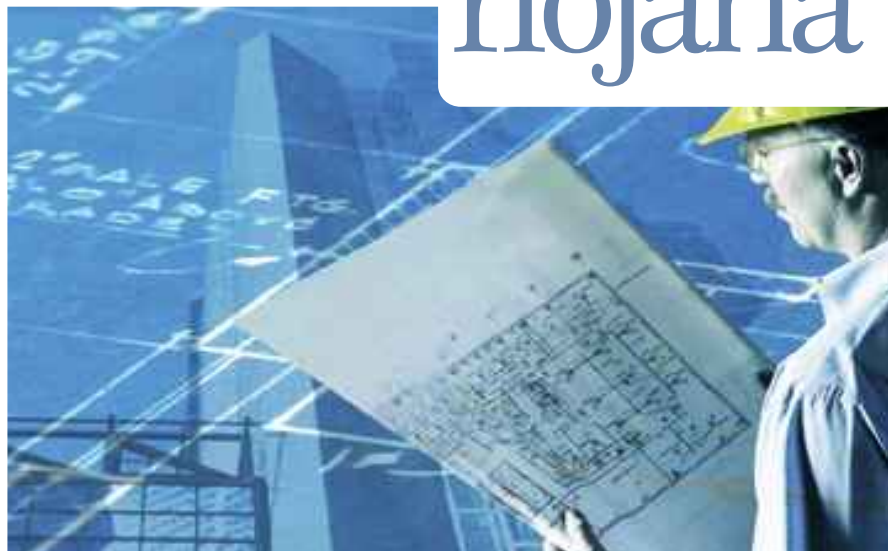
El sector de la construcción mantiene el buen tono de años anteriores.

Otra de las conclusiones más positivas del informe de la FER es el aumento del número de empresas respecto al año