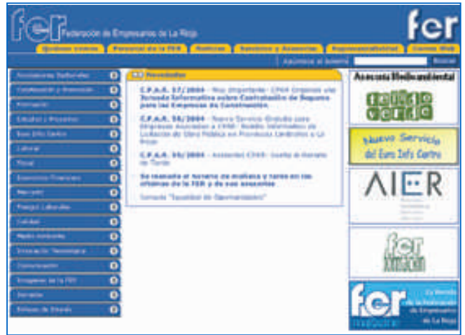
NUEVA IMAGEN: Bajo una nueva estética, la web presenta novedosos contenidos que persiguen una total transparencia del funcionamiento de la federación, además de una mayor interacción con el asociado.

La FER ha querido dar un paso más en la calidad de los múltiples servicios que ofrece a sus asociados, trabajando en su apuesta por las nuevas tecnologías y por la normativa ISO14001. Esta vez, lo ha logrado gracias a la reestructuración que ha llevado a cabo en su página web ( www.fer.es ), que se ha convertido en una herramienta más completa e interactiva para todos sus usuarios, que ahora pueden incluso aportar sus comentarios en el buzón de sugerencias . Bajo una nueva imagen gráfica, sus me-